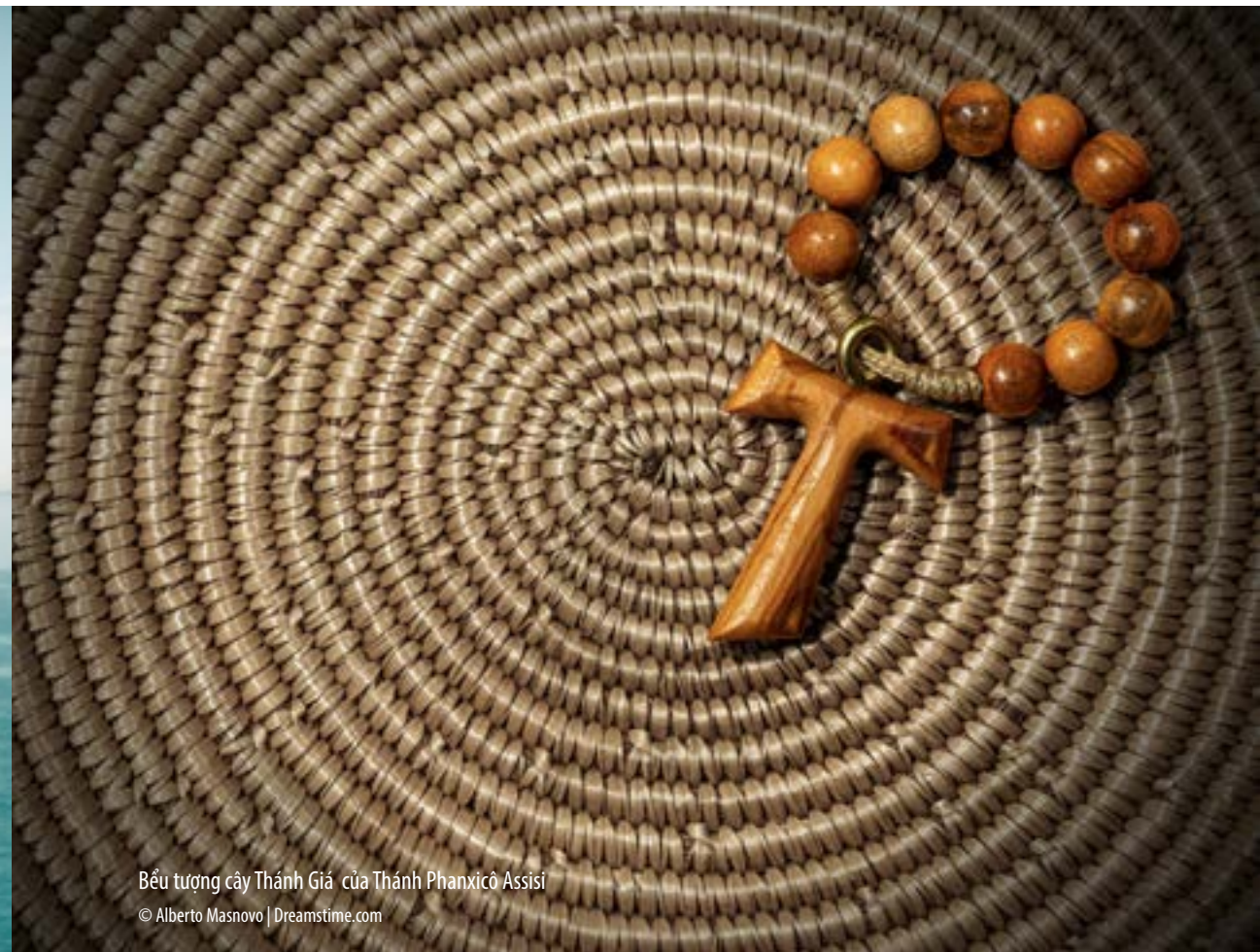
Bểu tượng cây Thánh Giá của Thánh Phanxicô Assisi