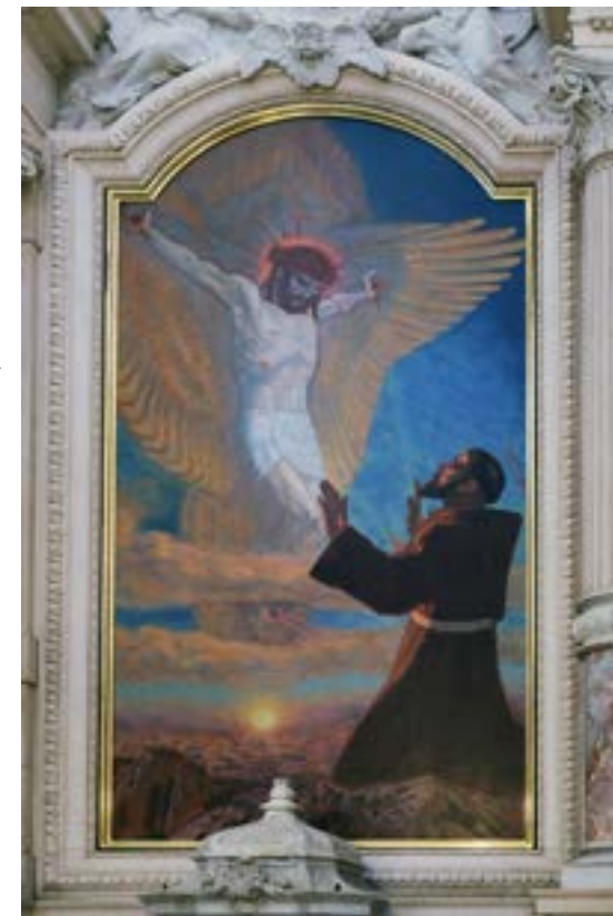
Bàn thờ trong Nhà thờ Truyền tin Phanxicô Quảng trường Preseren ở Ljubljana, Slovenia

“Phanxicô thấy một Thiên thần Sốt Mến có sáu cánh, sáng rực như lửa, từ trời bay xuống. Thiên thần bay rất nhanh và khi đến một chỗ ở trên không sát cạnh người của Chúa, giữa các cánh hiện ra hình tượng một người chịu đóng đinh, hai tay và hai chân dang ra như theo hình thập tự và đóng chặt vào một cây khổ giá. Hai cánh đưa lên trên đầu, hai cánh xoè ra để bay, và hai cánh khác che toàn thân [...]. Sau linh kiến biến đi, để lại trong trái tim ngài một sự nhiệt tình diệu kỳ và in vào xác thịt ngài hình tượng không kém phần diệu kỳ của các dấu thánh” (1Bon 13,3).