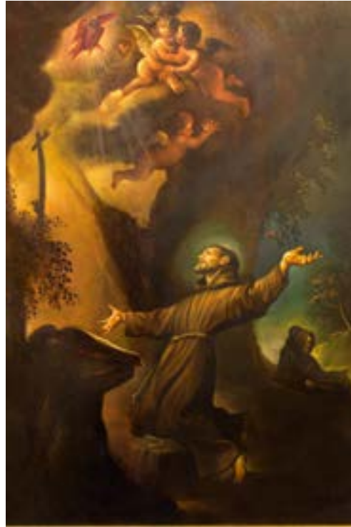
Nhà thờ Tu viện Capuchin (Nhà thờ Holy Anchel)

Trong cuộc đời thánh Phanxicô đã có ít nhất ba lần nhìn thấy thị kiến về Thánh Giá Chúa Kitô. Lần đầu tiên là giấc mơ tại Spôlêtô, Chúa cho ngài thấy một toà lâu đài rộng lớn và nguy nga, có nhiều vũ khí gắn huy hiệu Thánh Giá của Chúa Kitô. Lần thứ hai tại nhà nguyện San Đamianô, khi tâm hồn được biến đổi hoàn toàn, ngài đi ngang và vào cầu nguyện tại nhà nguyện ấy và ngài thấy thị kiến bức họa vẽ Chúa Kitô chịu đóng đinh mấp máy đôi môi và gọi tên chàng: “Phanxicô, hãy đi xây lại nhà ta, con thấy đó, nó đang đổ nát hoang tàn” và chàng đã thực thi lệnh truyền từ thánh giá Đamianô (x. 2Cel 10; 3Cel 2). Và lần thứ ba là thị kiến Thiên thần Sốt Mến hiện ra như đang bị đóng đinh trên thánh giá và sau đó là sự xuất hiện của Năm Dấu Thánh trên thân thể ngài (x. 1Cel 94; 3Cel 4; 1Bon 13,3; 2Bon 6,1.9).