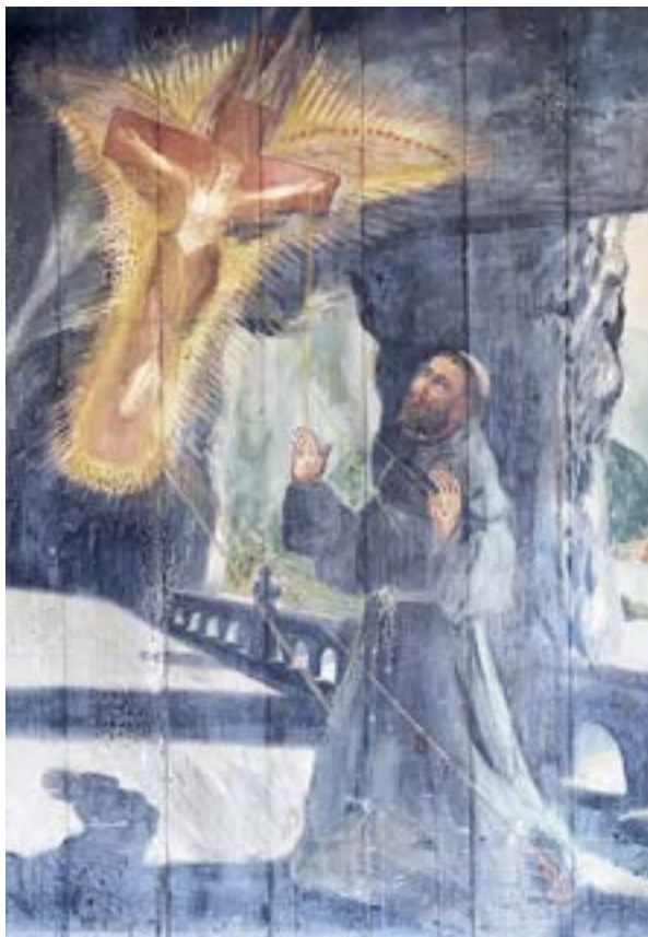
Thị kiến của Thánh phanxicô Nhà thờ Painted trên Đảo Lớn, Hawaii.

Thánh Phanxicô nhận Năm Đầu Thánh từ một thị kiến về Thiên thần Seraphim sáu cánh trong hình tượng một người chịu đóng đinh hiện ra với ngài, và đó chính là hình ảnh Chúa Kitô bị đóng đinh vào cây khổ giá dưới dáng vẻ Thiên thần Sốt Mến (x. 1Bon 13,3). Seraphim trong tiếng Hípri là שֶׁרָפִיִם, nghĩa là Bùng Cháy, đó là tên của một phẩm thiên thần. Dựa vào sách Isaia (Is 6,2-3) chúng ta biết Thiên thần Seraphim có sáu cánh: hai cánh để che mặt, hai cánh để che chân và hai cánh để bay. Các Thiên thần Seraphim hằng hầu cận trước ngai Thiên Chúa ngày đêm đối đáp tung hô: “Thánh! Thánh! Chí Thánh! Đức Chúa các đạo binh là Đấng Thánh! Cả mặt đất rạng ngời vinh quang Chúa!” (Is 6,3).