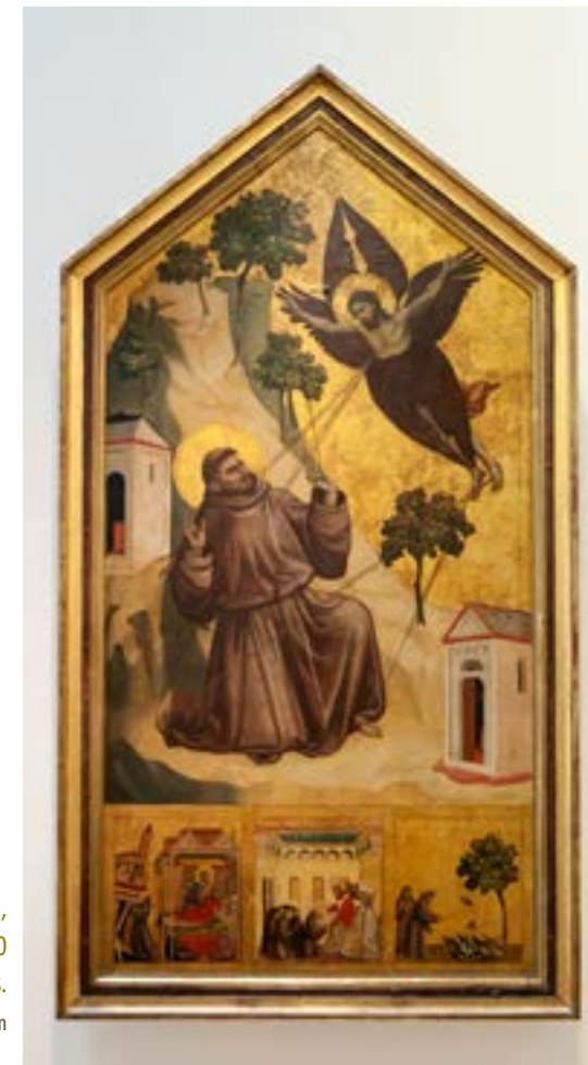
Thánh Phanxicô Assisi Nhận Thánh tích, bức tranh của Giotto, bị xử tử vào khoảng năm 1295-1300 và được lưu giữ tại Bảo tàng Louvre ở Paris.

Qua biến cố thánh Phanxicô được in Năm Dấu Thánh, chúng ta được mời gọi sống đời cầu nguyện trong thinh lặng, để giúp chúng ta lắng nghe chính mình, mọi người và Thiên Chúa (trích “ Cử hành ân ban Năm Dấu Thánh ”).