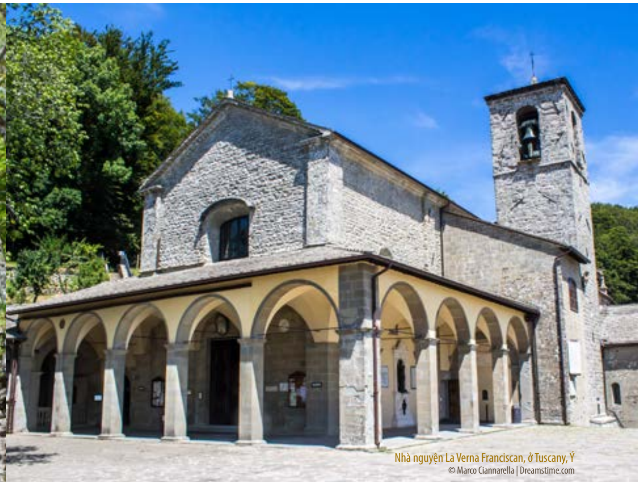
Nhà nguyện La Verna Franciscan, ở Tuscany, Ý