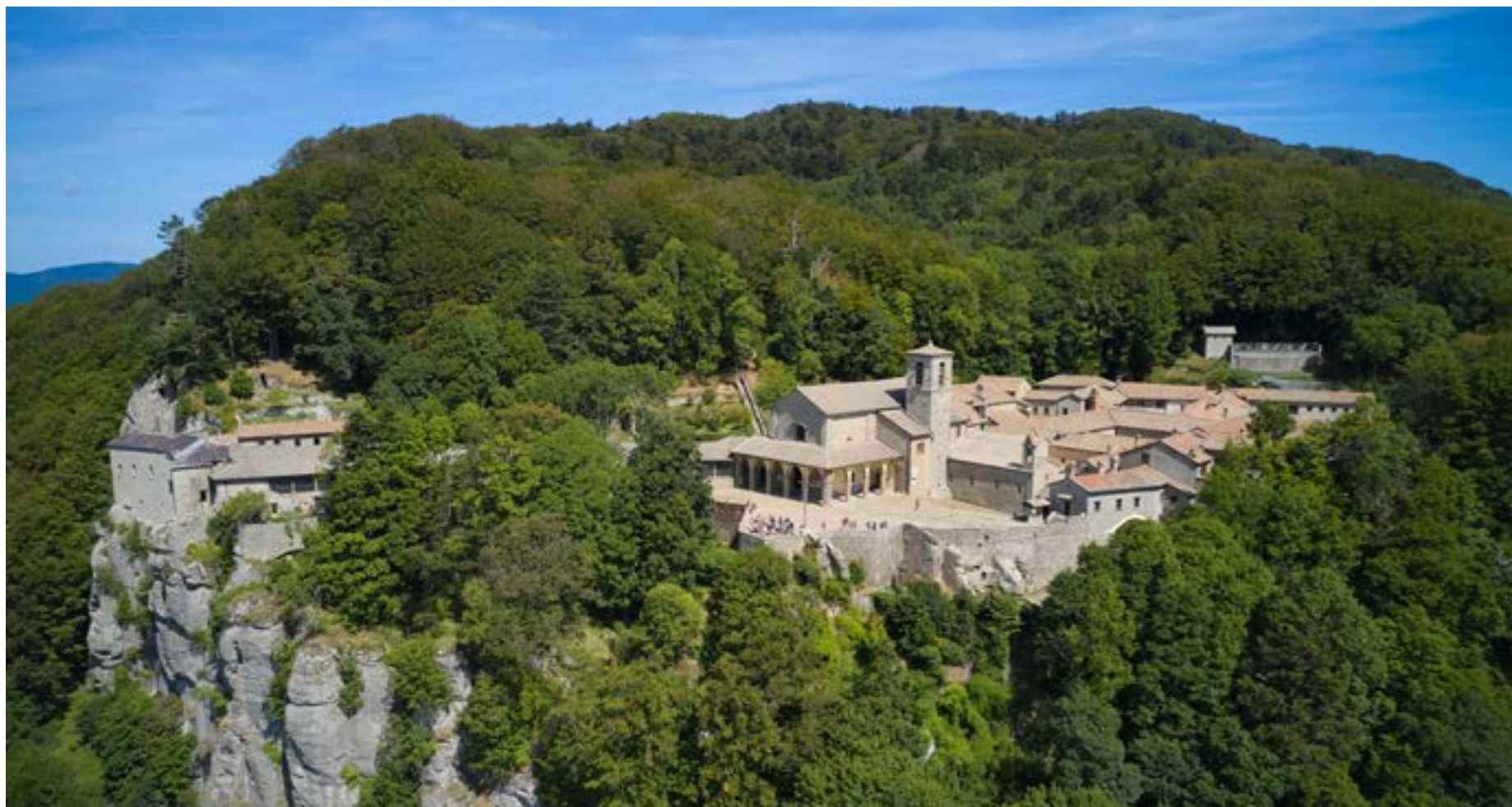
Thánh đường La Verna , Toscana, Italy Nhìn từ trên cao

Thánh Phanxicô được in Năm Đầu Thánh trên núi La Verna . Núi La Verna cao khoảng 1269m so với mực nước biển, thuộc tỉnh Arezzo, trong vùng Toscana, miền Trung Italia. Thánh Phanxicô được bá tước Orlando di Chiusi kính tặng khu vực này vào năm 1213.