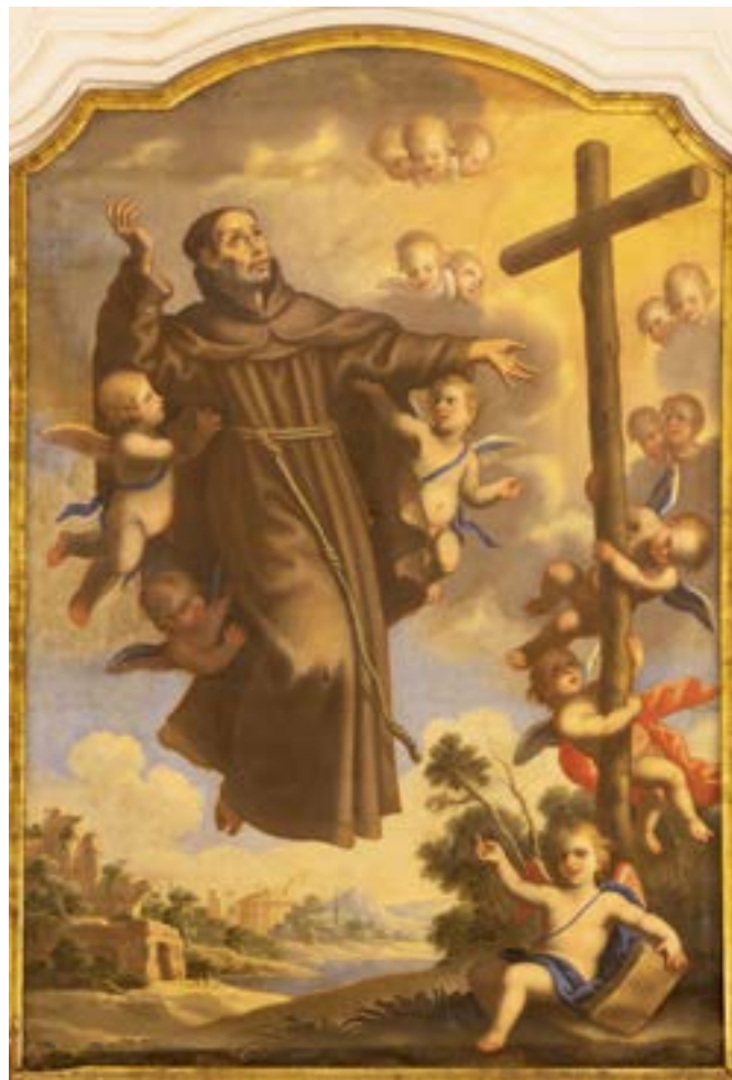
Thánh Phanxicô Assisi với cây thánh giá trong nhà thờ Chiesa di San Antonio

Các Dấu Thánh in trên thân xác là hiện tượng huyền bí và cũng gây ra nỗi đau thể lý, thánh Phanxicô quả quyết mọi hình thức tử đạo nào cũng còn êm ái hơn và ngài thêm rằng: “Thánh ý Chúa khiến những gì khó khăn trở nên nhẹ nhàng”.