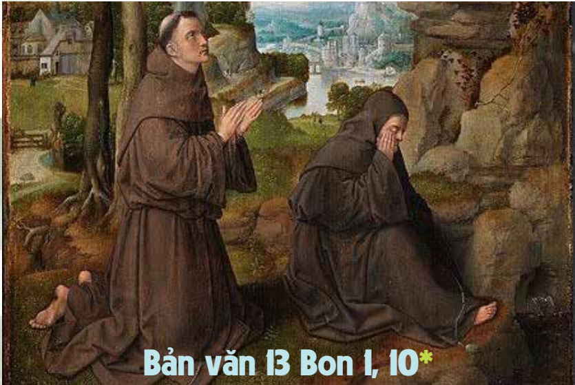
Bản văn 13 Bon I, 10*